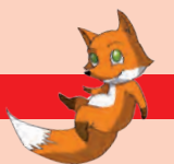
Illustration & Gestaltung: Barbara Seiler